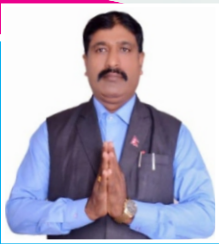
सहायक प्रमुख/प्रमुख उपायुक्त/प्रमुख