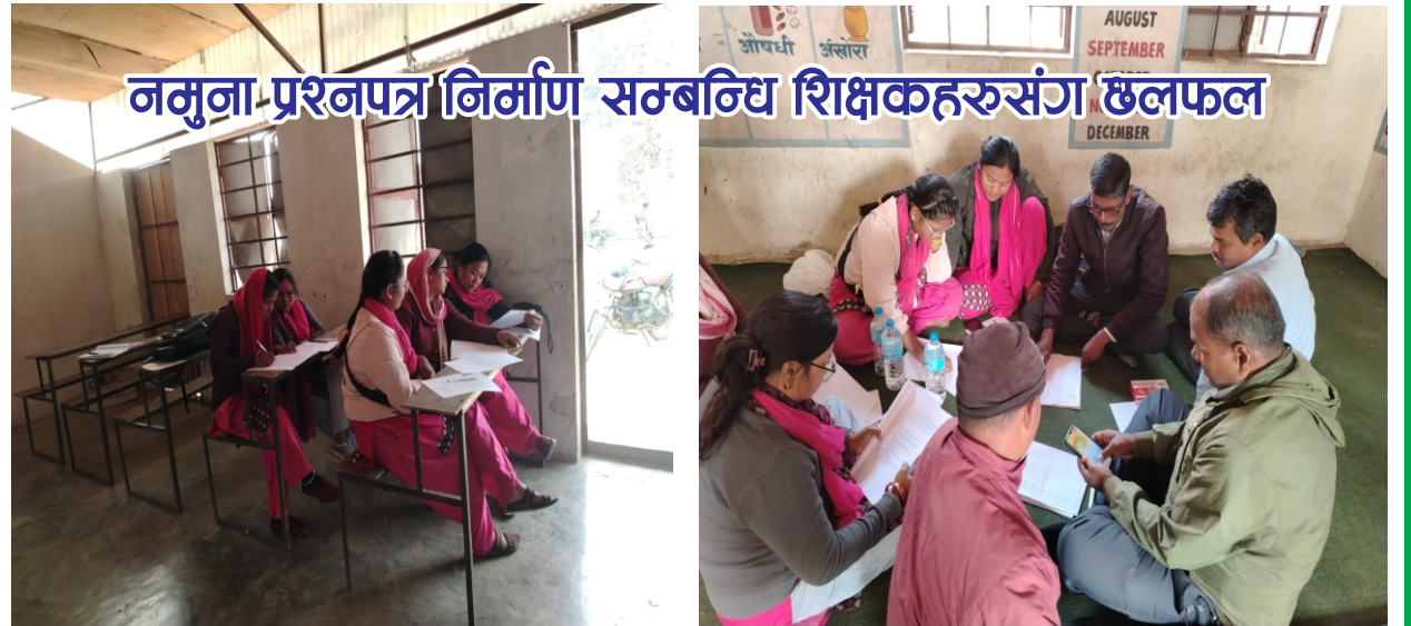
नमुना-प्रश्नपत्र निर्माण सम्बन्धि शिक्षकहरूसँग छलफल