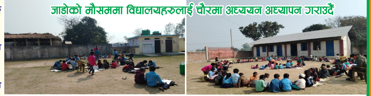
जाडोको मौसममा विद्यालयहरूलाई चौरमा अध्ययन अध्यापन गराउँदै