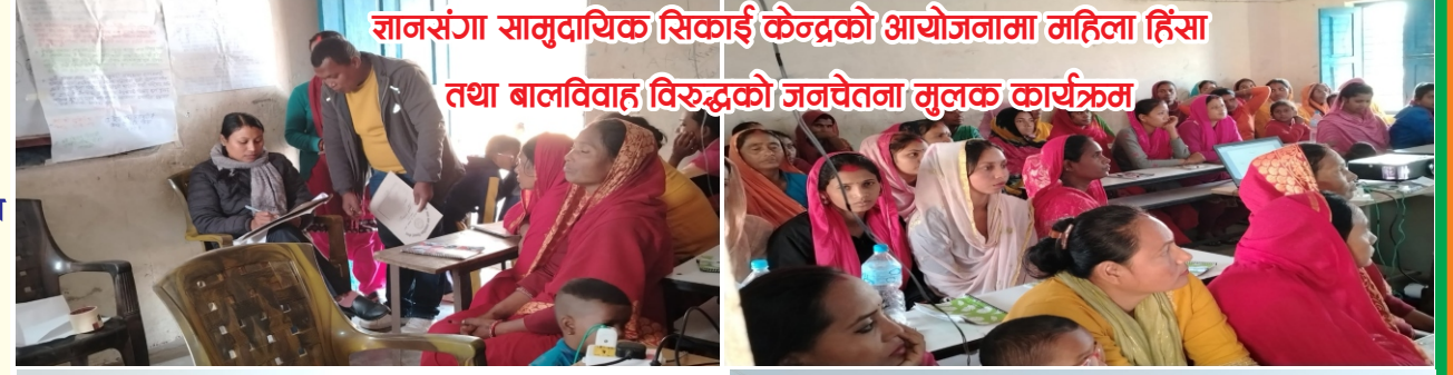
ज्ञानसंगा सामुदायिक सिकाई केन्द्रको आयोजनामा महिला हिंसा तथा बालविवाह विरुद्धको जनचेतना मुलक कार्यक्रम