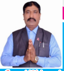
सहायक प्रमुख/उपप्रमुख उपप्रमुख