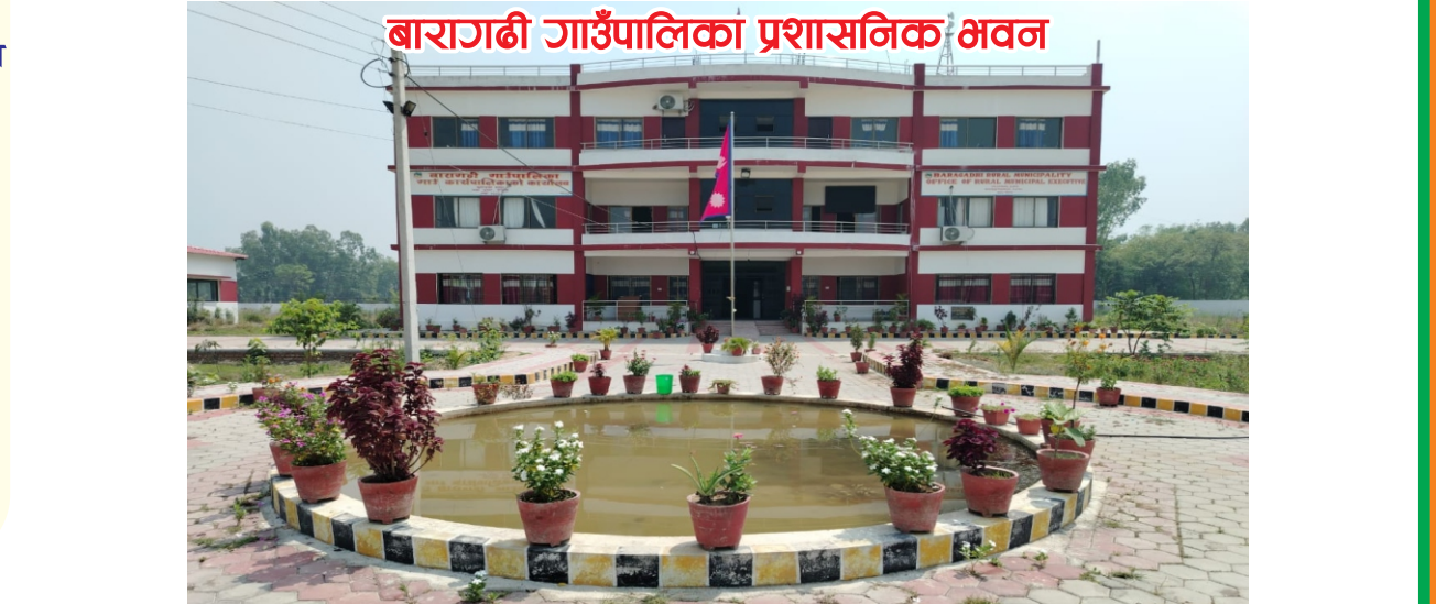
बारागढी गाउँपालिका प्रशासनिक भवन