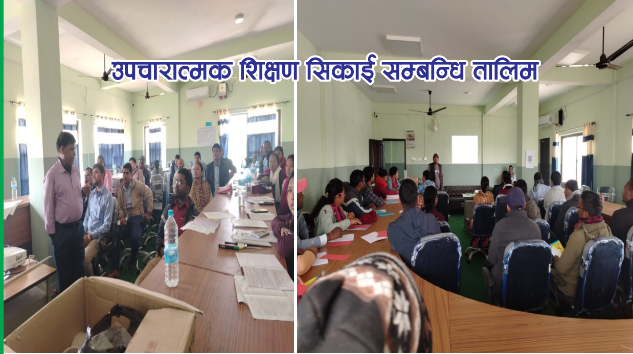
उपचारात्मक शिक्षण सिकाई सम्बन्धि तालिम