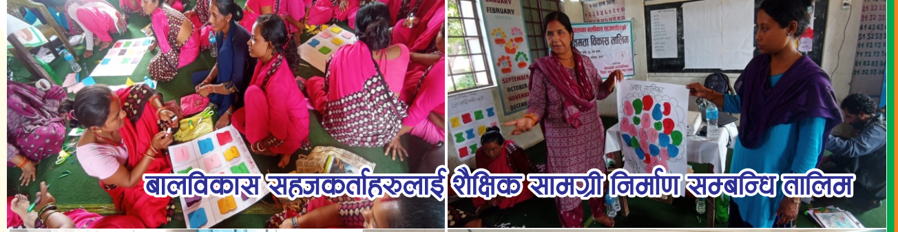
बालविकास सहजकर्ताहरूलाई शैक्षिक सामग्री निर्माण सम्बन्धि तालिम